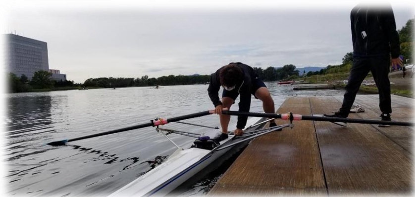
マスクを着けたまま蹴り出した 玉腰(1)

最後にコロナ渦の大変の中スタッフさんや、監督、先輩方の厚い手助け、大変助かりました。本当にありがとうございました!!